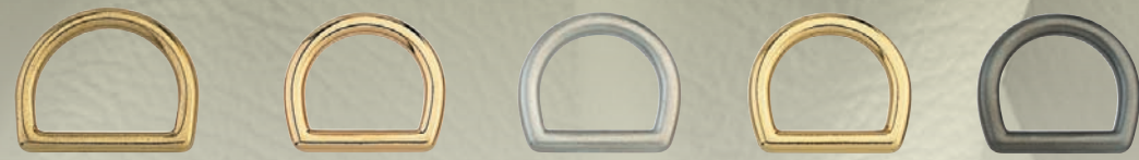
FINITIONS COLORÉES COLORED FINISHES / FINITURE COLORATE